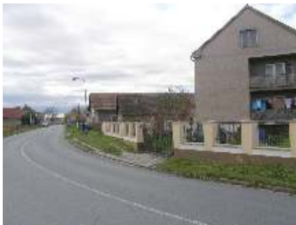
„Chodníky“ před výstavbou

Nejlepší angažmá bylo určitě v Bulharsku a