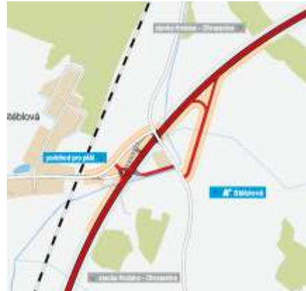
Schéma: Sjezd sil. I/37 MKÚ Stěblová, dle SD

V letošním roce bude provedena pouze p eložka kabel Telefonika O2 a drobné p ípravné práce, zemní práce v etn skryvek ornice jsou naplánovány až pozim .