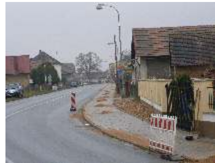
Chodníky po výstavbě